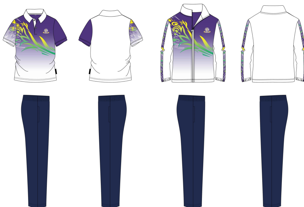
（福州外国语学校初中生校服款式）

1、款式标准：严格参照福州外国语学校 2024 级学生校服款式，需保持款式一致性，不得擅自修改设计细节（包括领口、袖口、标识位置、拉链样式等），图样如下：