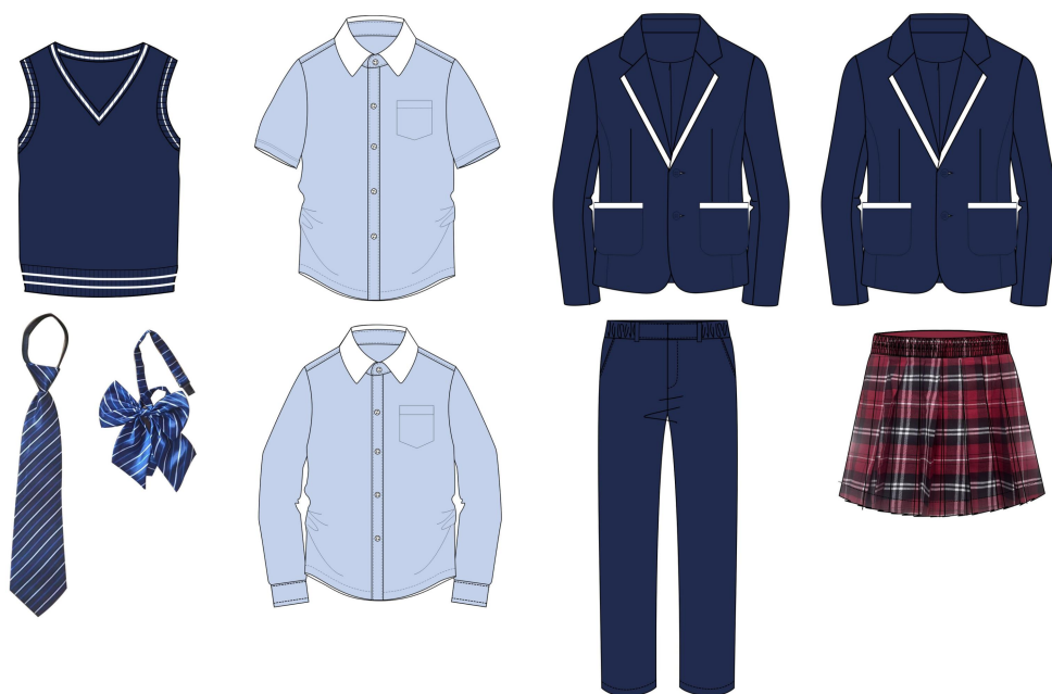
（福州外国语学校初高中生制服款式）

2、 颜色要求： 颜色种类、色号需完全符合学校指定标准，确保批次间颜色无明显差异，符合视觉统一要求。